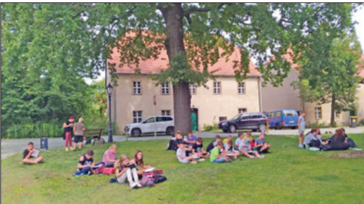
Zeichnen vor dem Kirchgebäude in Ruhland