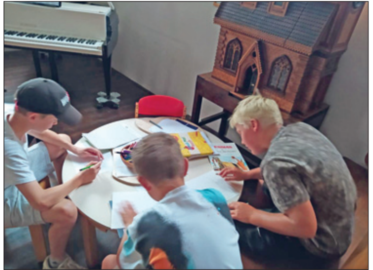
Zeichnen in dem Kirchgebäude in Ruhland

Die flexiblen Pläne zum Ankommen und gemeinsam Starten hatten viel Spielraum für Teamtrainings und Ausflüge. So hat zum Beispiel die 6a einen Ausflug am Donnerstag unternommen, der allerdings auf Grund einer Störung des Bahnverkehrs nicht nach Dresden in die Gemäldegalerie führte, sondern spontan mit vielen Zeichenübungen in der Umgebung verbracht wurde.