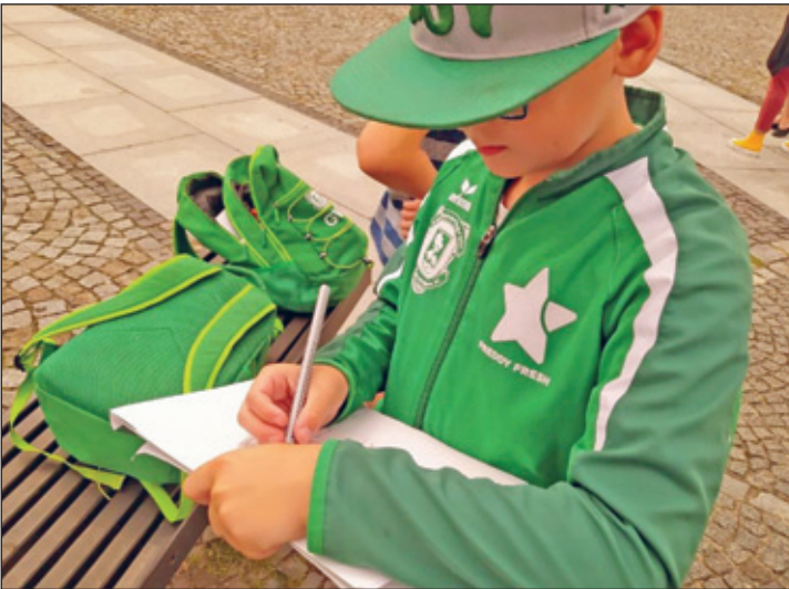
Gegenseitiges Zeichnen am Brunnen